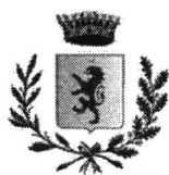
COMUNE DI ROCCAFIORTA