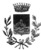
COMUNE DI ANTILLO